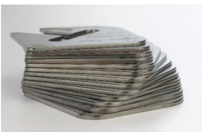
Bild 1: Metallisch blanke Schnittflächen dank der HiFinox-Technologie für das Plasmaschneiden von Edelstahl und Aluminium