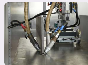
Modifizierte Anordnung der Schlepparme

Pulverrückführung Fahrbahn Sonderausführung für Fülldraht