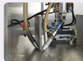
Modifizierte Anordnung der Schlepparme