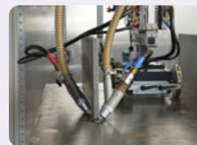
Modifizierte Anordnung der Schlepparme

Pulverrückführung Fahrbahn Sonderausführung für Fülldraht