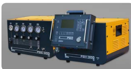
Gasversorgung manuell: PGE-300, automatisch: PGV-300 Gas supply manual: PGE-300, automated: PGV-300