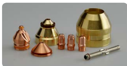
Verschleißteile mit langer Lebensdauer Consumables with long lifetime