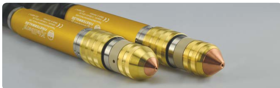
PerCut-Brenner: auch für Fasenschnitte bis 50° | PerCut torches: also for bevel cutting up to 50°

Newly developed gas supply units are available for the Smart Focus series, either manual or fully automated. With these the user achieves best cutting results with highest, reproducible quality. The new torches PerCut 2000 and PerCut 4000 have been improved as well. They provide precise cuts and highest cutting speeds. Their unique cooling system guarantees longest consumable life and reduces the gas consumption and costs per cutting metre.